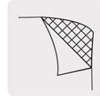
Respaldo de tela