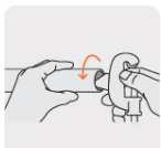
Removedor de rebabas