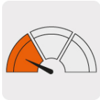
Baja resistencia a la flexión