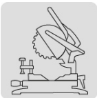
Para sierra de inglete