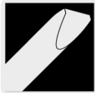
Punta en "V"