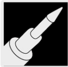
Punta cónica fina